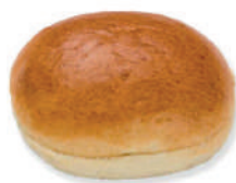
PAN HAMBURGUESA BRIOCHE PREMIUM

Con harina de trigo y patata que le aporta una suave textura, y con una forma diferenciadora que le da un aspecto premium.