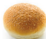
MINI PAN HAMBURGUESA RÚSTICO

Pan premium por su forma diferenciadora de líneas cruzadas en la parte superior, espolvoreado con harina de trigo. Además posee una miga más densa.