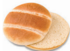
PAN HAMBURGUESA PATATA

Horneado con mantequilla para lograr una textura suave y un ligero sabor dulce. Tiene una superficie brillante y una miga extra-densa.