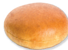
PAN HAMBURGUESA PATATA PREMIUM

Pan de hamburguesa brioche de textura ligera y sabor suave que hace de este pan un resultado premium.