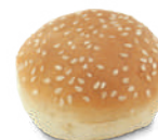
MINI PAN HAMBURGUESA SÉSAMO

Mini panecillo con masa aireada y esponjosa con topping de sémola.