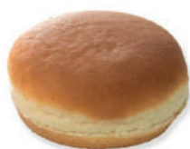
PAN HAMBURGUESA BRIOCHE